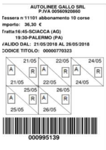
Illustrazione 1: esempio di abbonamento settimanale di 5 corse A/R